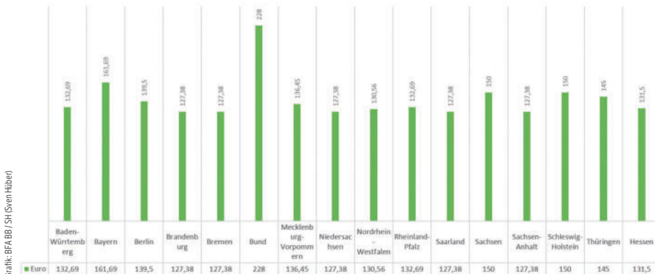
Grafik: BFA/BB/SH/Sven Hüber

unbedingt will? Man hat ja auch den Ausbau der A 49 durchgezogen oder den Bau von Terminal 3 hingenommen. Liebe Grünen im hessischen Landtag, springt über euren Schatten und heuchelt nicht nur Wertschätzung für die hessische Polizei! Erfüllt diese Sprachhülsen auch mal mit Leben! Neben der Ruhegehaltstauglichkeit wäre auch eine Erhöhung der Polizeizulage mehr als überfällig. Mit den aktuell 131,20 € gewinnt man nicht mal die sprichwörtliche „goldene Ananas“. Hier sind die üblichen Verdächtigen mal wieder als Vorreiter zu nennen, was für die hessische Polizei wieder mal ein Standortnachteil darstellt. Bayern bietet 161,69 € als Polizeizulage auf und die Bundespolizei hat diese Zulage gar auf 228 € erhöht, das ist fast das Doppelte zur hessischen Polizeizulage. Die Anpassung der Polizeizulage wäre auch eine gute Möglichkeit, der Polizei außerhalb des nicht unbedingt gelungenen Tarifabschlusses die berühmte Wertschätzung zukommen zu lassen. Und auch die Politik sollte sich immer vor Augen halten: „Nach der Wahl ist vor der Wahl!“ Wir werden als Gewerkschaft der Polizei in Hessen nicht müde werden, diese Forderung an die jeweilige Landesregierung heranzutragen. Aktuell ist es noch Schwarz-Grün, wenn sich die Zeiten ändern, werden wir aber auch den dann regierenden Parteien den Spiegel vorhalten und sie an ihren Aussagen messen. Und warum? WEIL WIR ES WERT SIND!