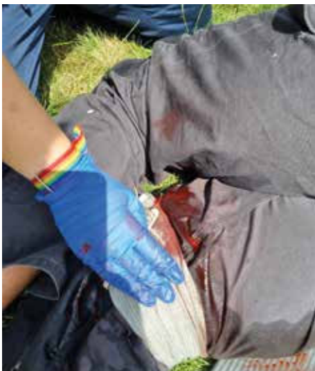
Wichtig sind realistische Szenarien.

A: Anfang 2021 habe ich im Internet nach Erste-Hilfe-Kursen gesucht, da mich dieses Thema sehr interessiert, und habe die GdP-