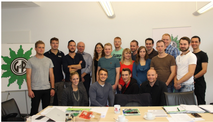
(Gruppenfoto des Bundesjugendvorstands)